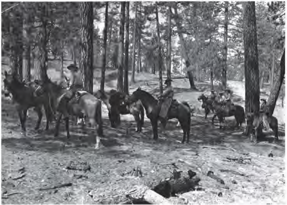
Figura 15. Aida Meling con amigas y familiares de paseo, 1960. Sierra de San Pedro Mártir.