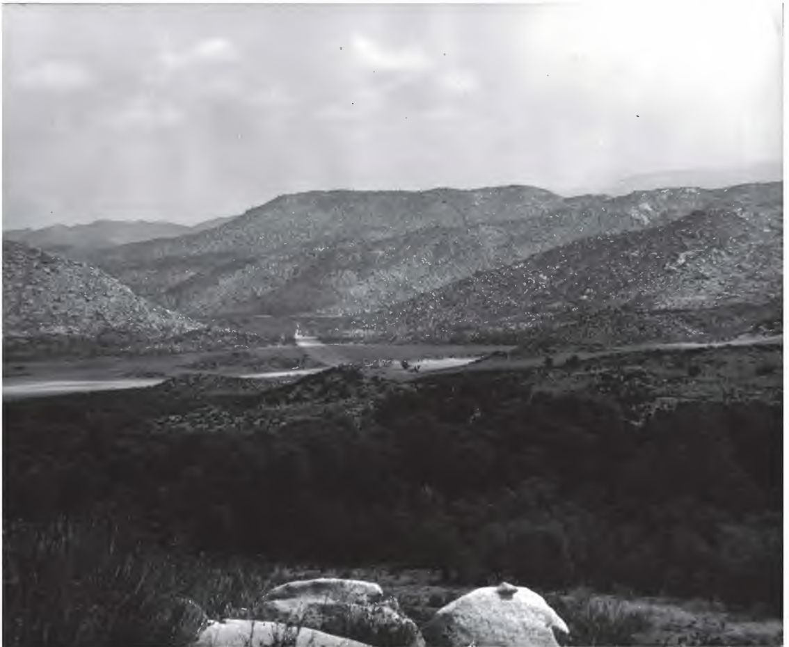
Figura 2. Arroyo San José y pista de aterrizaje del Rancho Meling, 1960. Atrás la sierra de San Pedro Mártir. Fotografía tomada desde el panteón del rancho.

este Rancho ganadero se constituye en uno de los primeros centros de contratación de indígenas. Durante la Revolución mexicana, el entonces Rancho San José es objeto de los ataques magonistas, quienes tomaron Baja California en enero de 1911 e instauraron lo que dieron en llamar la Primer República Socialista del mundo (Vío, 1990:82). Después de la revolución y ante la terminación del auge minero, el Rancho Meling se reconstruye y reorienta su actividad hacia el sector turístico, y tras algunos altibajos que fueron reflejo de la inestabilidad del México posrevolucionario, este nuevo centro turístico desaparece absorbido por las deudas bancarias al llegar a su fin el siglo XX. Ya en el siglo XXI, los descendientes de sus propietarios originales refundan y modernizan el rancho, y con el auxilio del Internet y las redes sociales, logran posicionarlo internacionalmente como empresa ecoturística.