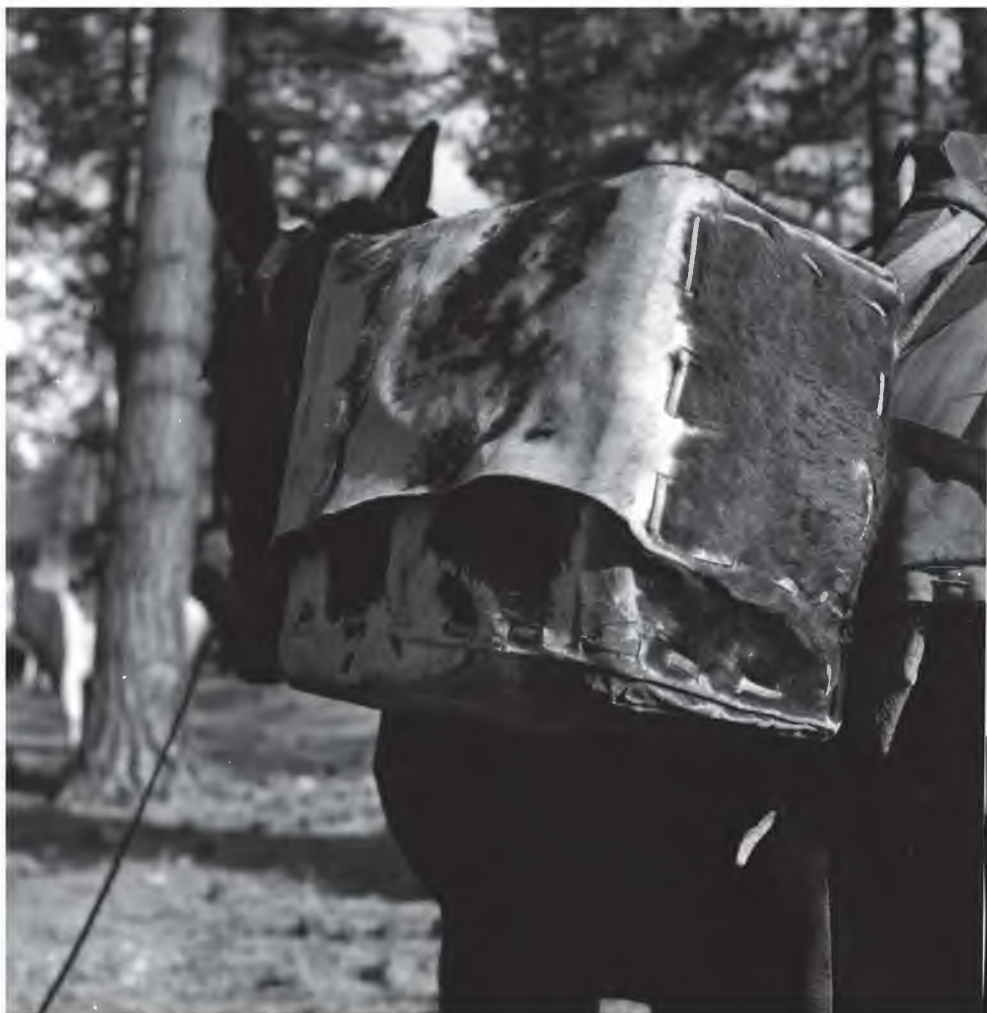
Figura 3. Caballo equipado con alforja de piel vaquera, preparado para un viaje a la sierra de San Pedro Mártir. Sin fecha.