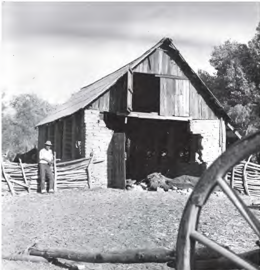
Figura 10. Eulogio Pompa descansando en las caballerizas, 1950. Rancho Meling. Archivo familiar.