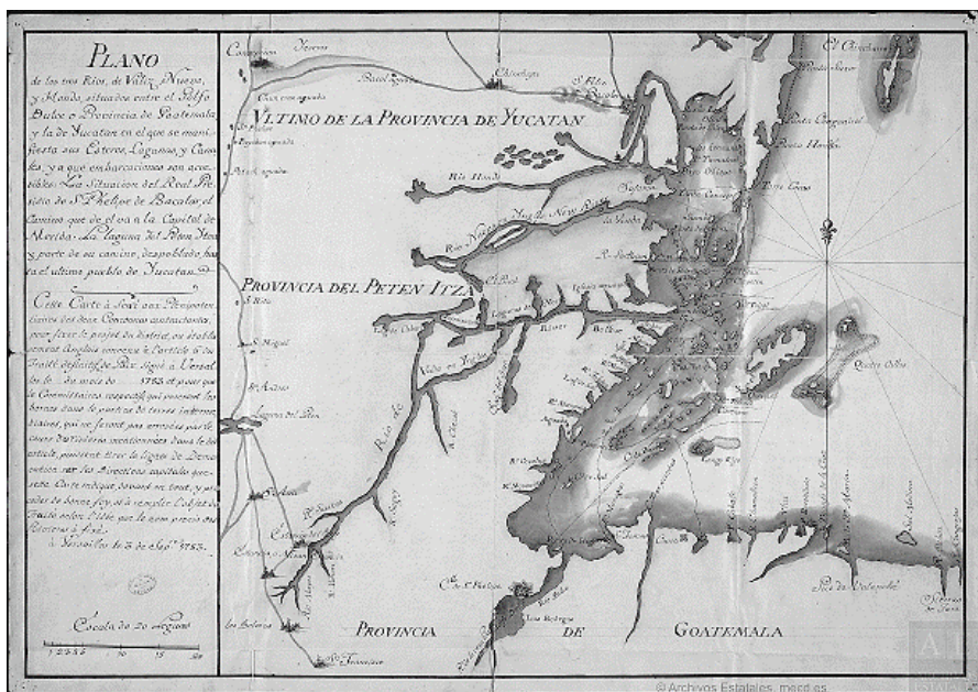
Figura 1. El suroriente de la provincia de Yucatán. El presente mapa fue elaborado para mostrar el territorio que sería entregado a los británicos para la explotación maderera conforme al Tratado de Versalles de 1783. Pueden apreciarse los principales ríos de la región: el Hondo, el Nuevo y el Belice.

más, el gobernador Antonio de Figueroa y Silva restauró la villa de Bacalar, con colonos provenientes de las Islas Canarias, y construyó la fortificación abaluartada de San Felipe entre 1727 y 1732. El infatigable militar envió a