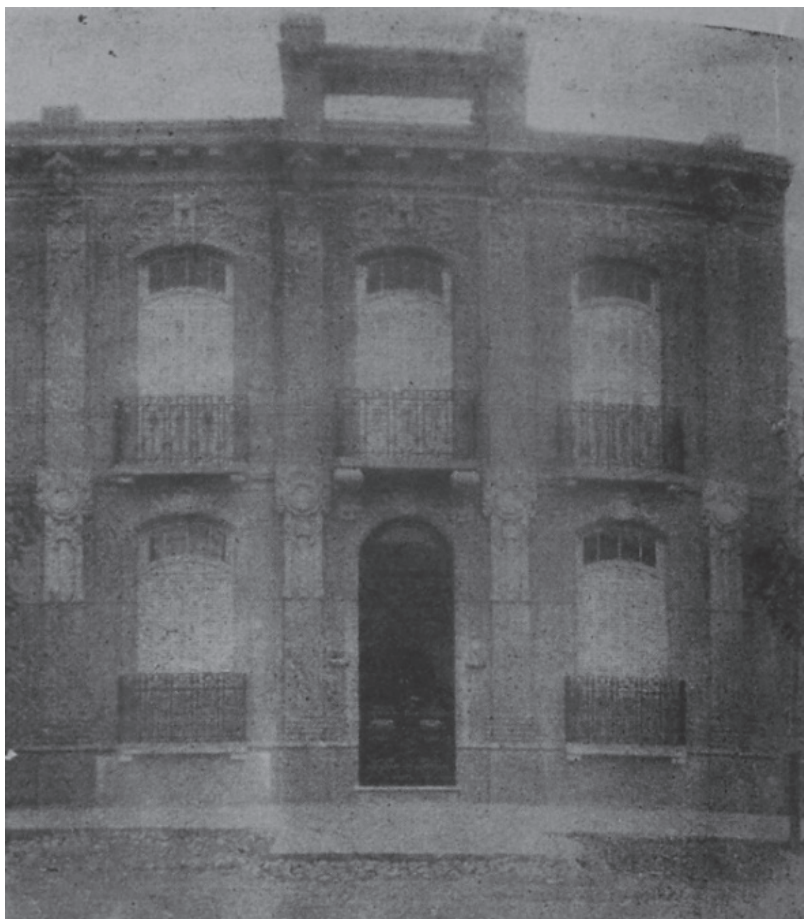
Fotografía 5. Regia Morada del doctor Castillo.

El interés por los asuntos técnicos que garantizaban la resistencia sísmica, se debía a la incidencia de estos en la provincia. La historia de la ciudad Mendoza estaba muy condicionada por los terremotos. Ejemplo de ello es el del 20 de marzo de 1861 que destruyó casi completamente la ciudad de trescientos años, para entonces el país se encontraba en un período de organización nacional que propició la intención de eliminar de la representación