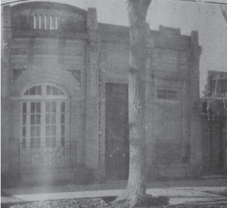
Fotografía 4. Casa del Ingeniero Zúñico.

las viviendas mencionadas, destacando la labor de la Constructora Andina como empresa que colabora al embellecimiento y modernización de la urbe.