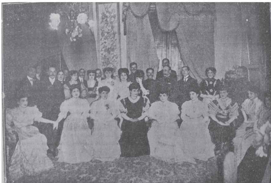
Fotografía 6. En lo de Huidobro.

de menores ingresos seguían empleando espacios con múltiples funciones, como es el caso del patio, que era lugar de encuentro, de juego, de alimentación y de trabajo.