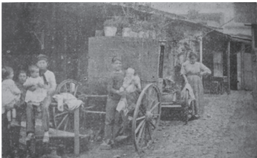
Fotografía 2. Vivienda de los suburbios.

En la constitución de la vivienda “moderna” tuvo trascendencia la diferenciación de las áreas públicas y privadas de la casa, 38 como es posible observar en los ejemplos citados, esto no sucedía en los espacios comunes se llevaban a cabo muchas de las actividades que luego fueron consideradas privadas, como el lavado de ropa, la cocción de alimentos, la alimentación, etc.