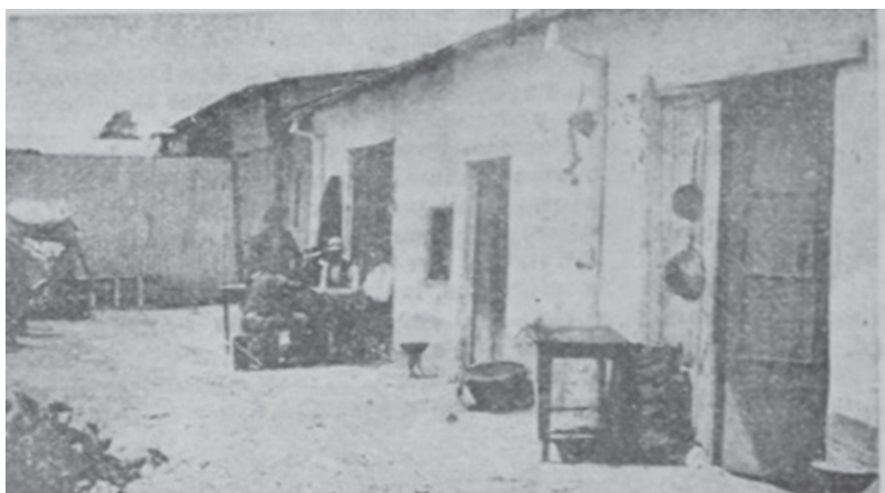
Fotografía 1. Suburbios de la ciudad de Mendoza.

En la Fotografía 1, podemos apreciar algunas de las características que eran comunes en estas casas refuncionalizadas en conventillos. El material utilizado era el adobe, tenía el característico techo de rollizos y presentaba dinteles de madera en las puertas de doble hoja que, en general, eran de pino tea. Se destacan los desagües pluviales del techo. Su presencia resulta poco habitual en la provincia, debido a la escasez precipitaciones que se registran anualmente en Mendoza.