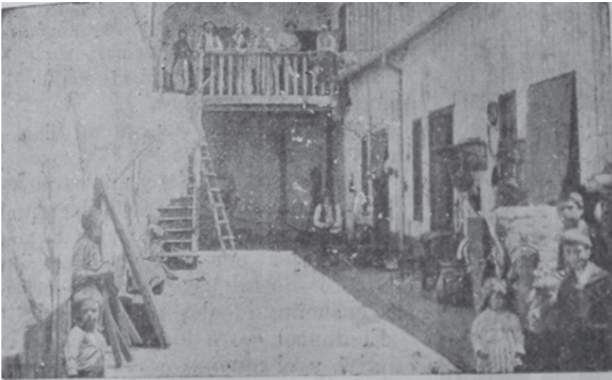
Fotografía 3. Conventillo de Mendoza.

Esto no se observa en la Fotografía 3, que presenta indicios de alguna intervención por parte del fotógrafo. Debido al posicionamiento de los distintos actores, podemos presumir que quien hizo la toma, indicó a los habitantes del conventillo que se ubicaran en los espacios laterales y que salieran a la barandilla del piso superior. Como en los ejemplos anteriores, el espacio del patio aparece rebosante de vida, repleto de niños y adultos. Como en el primer ejemplo, observamos los enseres ubicados a los lados de las puertas de las habitaciones. Pero la mencionada disposición a los laterales, nos dan la pauta de la intervención en cuanto a la organización de la escena.